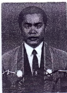
นายทะเบียน

ให้ไว้ ณ วันที่ 19 เดือน กันยายน พุทธศักราช 2551